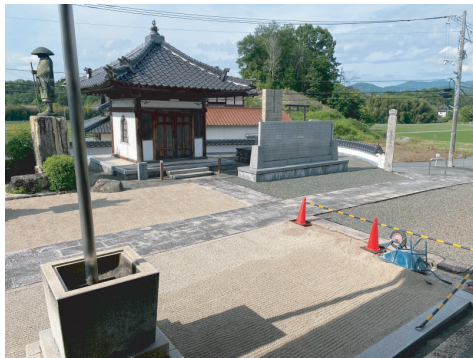
納骨堂への参道を整備中