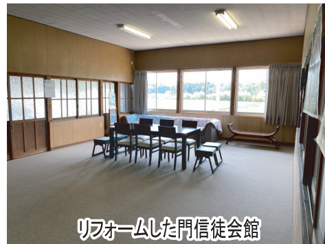
リフォームした門信徒会館

同時に、門信徒会館の修復をし、境内地の整備を進めております。門信徒会館は、畳の床が古くなり、カーペットの床に張り替え、南側の窓を新調しました。境内地は、大会受付テントを配置する付近を整備しました。納骨堂への参道に板石を敷き詰め、本堂正面の雨水枡を見えないように隠しました。これで、ほぼほぼ、大会の準備は整ったと思います。