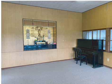
門信徒会館のお内仏

ここ敦煌莫高窟は、一つの石窟毎に鍵が掛かっており、ガイドの案内と一緒にでなければ、石窟内を見ることが出来ない。そんな訳で、私一人タクシーで行くことは避けたかったが、結局一人で行く事になった。