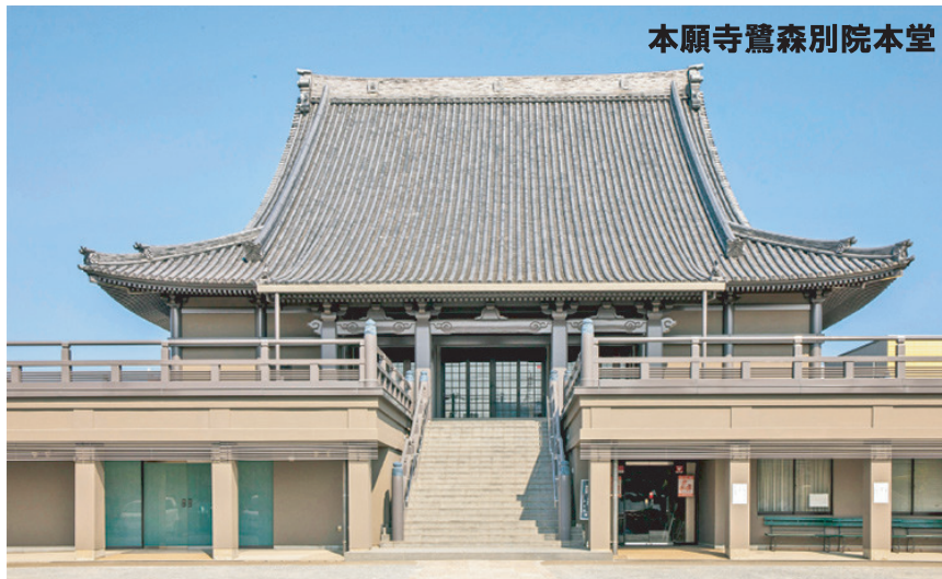
本願寺鷺森別院本堂

文明18年(1486)、第8代蓮如上人が紀伊国冷水浦(海南市)に下向され、本願寺の教勢は飛躍的に拡大。黒江、御坊山と寺基を移転。永禄6年(1563)に移した雑賀荘宇治郷鷺森の「雑賀御坊」が、現在の鷺森別院である。この地は雑賀門徒の拠点であり、熱心な護持崇敬を受けたという。和歌山市内に数カ所ある雑賀衆ゆかりの地の一つ。